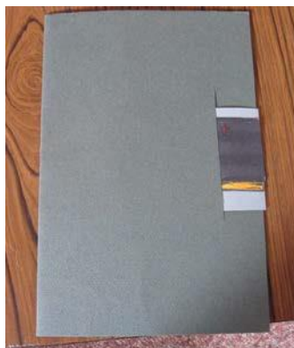
LANGUETTE - VERSO