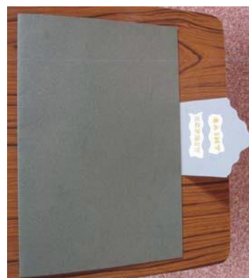
LANGUETTE – RECTO